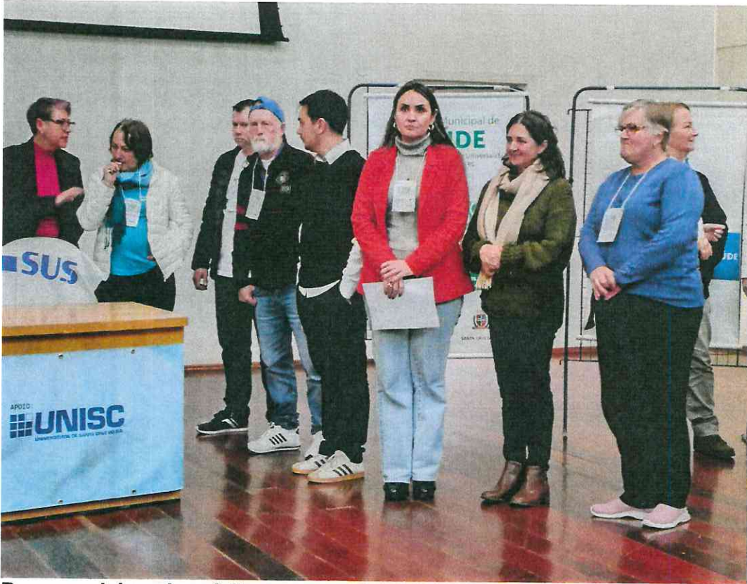
Pessoas delegadas eleitas para a etapa estadual – segmento pessoas usuárias