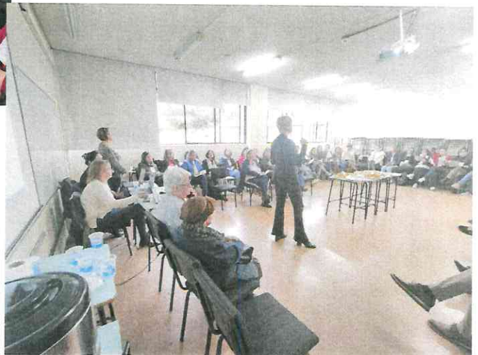
Trabalho em grupo por Eixo