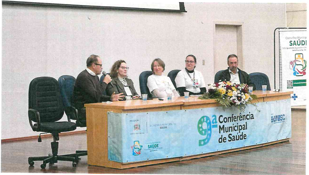
Mesa de abertura