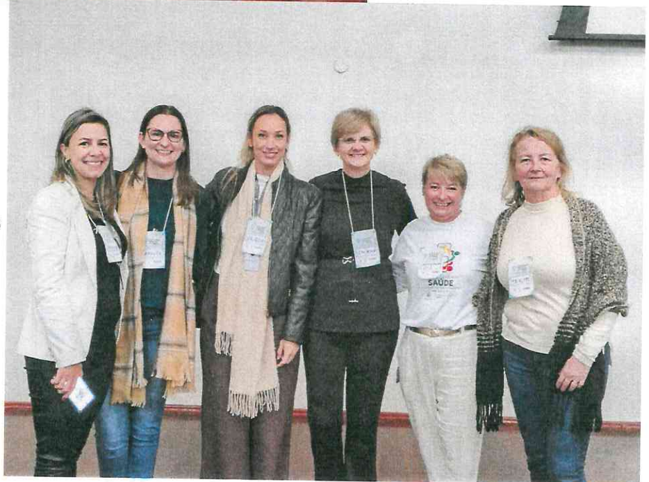
Pessoas delegadas eleitas para a etapa estadual – segmento pessoas gestoras