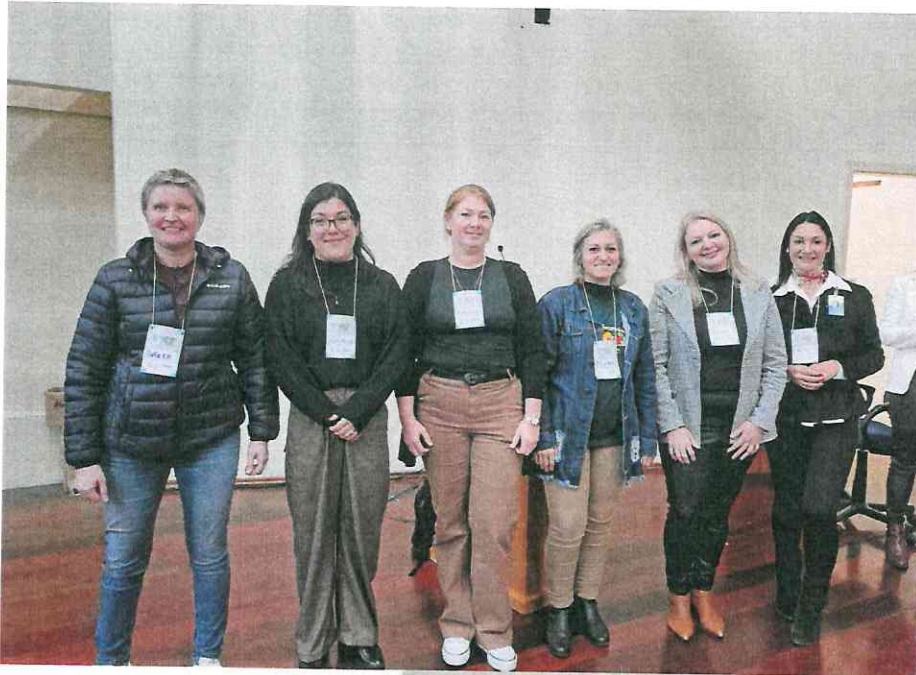
Pessoas delegadas eleitas para a etapa estadual – segmento pessoas trabalhadoras