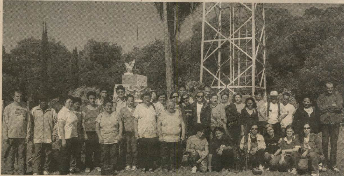
ALUNOS do Cemeja fizeram viagem de encerramento do ano letivo e se encantaram com a beleza do parque

Oraci sempre quis viajar para lugares diferentes. "Esperei meus filhos crescerem para aproveitar a vida. Agora é que 'tô' aprendendo a viver. Depois que entrei no Cemeja, conheci lugares que só ouvia falar no nome", relata ela, referindo-se ao Centro Municipal de Educação de Jovens e Adultos. De repente, em seus óculos se reflete a água cristalina da piscina, e sai mais um comentário: "Nem que eu fique encarangada, mas ali quero entrar." Fala sem se preocupar em ter que tirar a maquiagem feita às 5 da manhã.